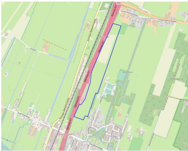
Het geplande zonnepark Groenekan, roze = de A27, middenonder: de bebouwing van Groenekan, rechtsboven de Nieuwe Wetering N234

BENG! heeft samen met BHM Solar het initiatief genomen om in Groenekan een zonneweide te