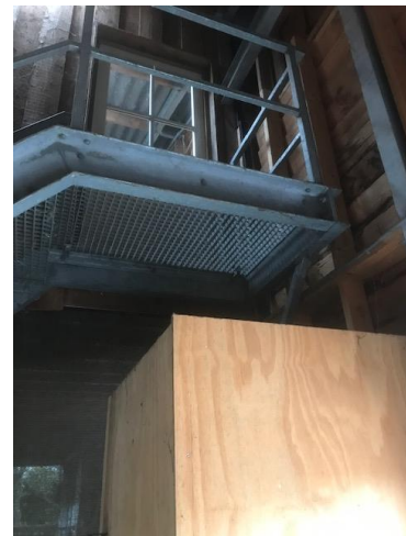
Open kast onder een open trap

De omvormer van de installatie op Nieuwe Toutenburg hangt onder een open trap. De ombouwkast is aan de bovenkant open. Daardoor valt er vuil en stof op de omvormer, met risico op storingen. We willen een "dak" boven de kast maken om vervuiling voortaan tegen te gaan. Wie kan helpen bij die klus? Graag melden via frans@biltstroom.nl . Na de aanpassing zal Green Link het apparaat schoonmaken en controleren.